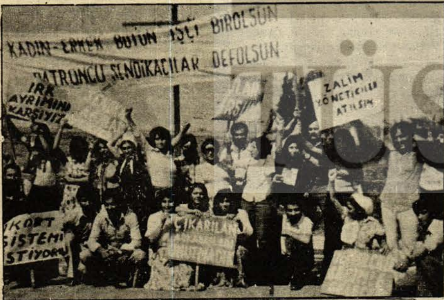
Faşist sendikacıları protesto eden bir grup işçi

Gerici patron uşağı sendika yönetimine karşı, SENDİKA DEMOKRASİSİ, HÜR VE DEMOKRATİK SEÇİM, İŞ GÜVENLİĞİ, DEVRİMCİ İŞÇİLERİN SENDİKA YÖNETİMİNE GELMESİ için mücadele veren TEKSA ve MENSA işçileri yalnız değildir. Onların mücadelesi bütün Çukurova işçilerine örnek oluyor ve destek görüyor. Teksa işçileri karşılarındaki güçlü düşmanı altetmek için kendi birliklerini sıkıca kurmalı, diğer fabrikalardaki işçi kardeşleriyle birleşmelidir. DİSK üyesi ve Türk-İş üyesi işçiler birbirinin mücadelesini desteklemeli, gerici yönetimleri yıkmalıdır.